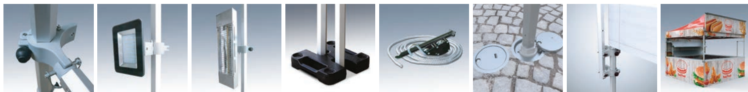
Bară de încălzire