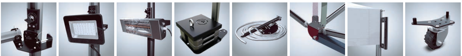
Bară de întărire